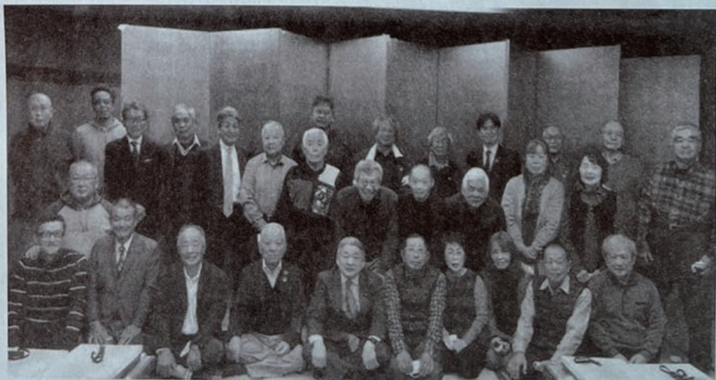
潮見地区まちづくり協定会構成団体交流会 (12/4 まさおか)