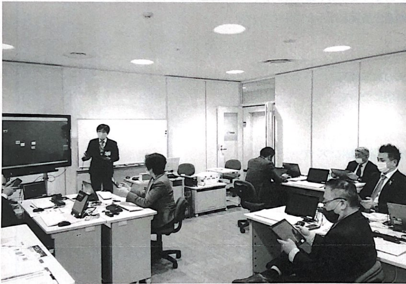
文教消防委員会にて松山市教育研修センターで先生が受ける視察研修も行う (1/27 教育研修センター)