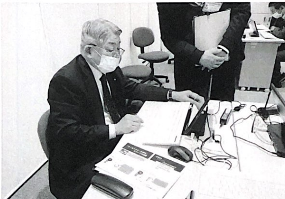
タブレット操作研修