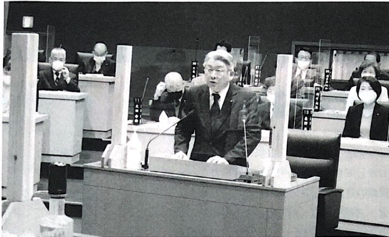
令和3年3月議会において、みらい松山副代表として代表質問を行う（2/26 本会議場）