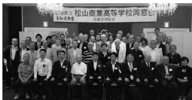
松山商業高校同窓会近畿支部総会(9/8 シェラトン都ホテル大阪)