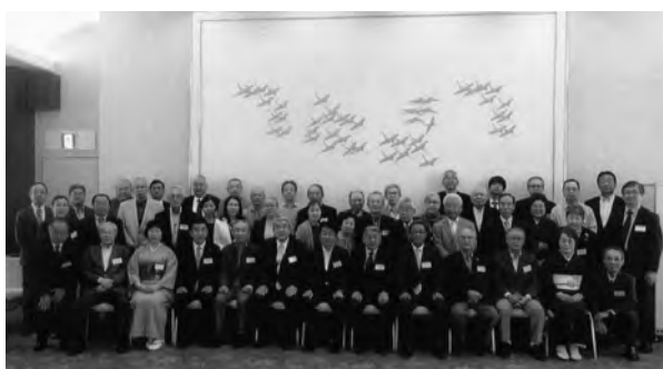
松山商業高校同窓会東京支部総会(5/19 法曹会館)