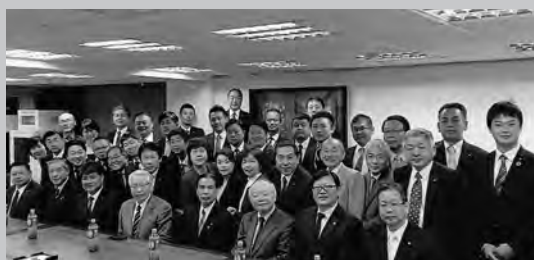
日本関係協会幹部の方々と