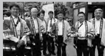
北投温泉まつりオープニングを前に(11/1 北投温泉)

台北市友好交流協定締結5周年記念事業として台北市を11月1日から4日まで市議会からは39名の議員が参加しました。