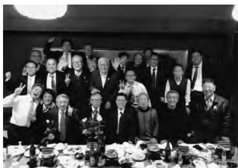
JA全農えひめ野球部送別会にて(3/19 駅前北斗)