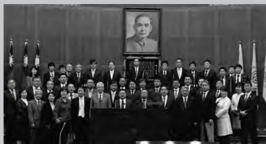
台北市議会を表敬訪問(11/4 台北市議会議場)

台北市友好交流協定締結5周年記念事業として台北市を11月1日から4日まで市議会からは39名の議員が参加しました。