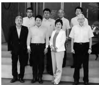
都市企業委員会にて会津若松市を視察