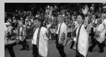
温泉まつりオープニングセレモニー(11/1 セレモニー会場)