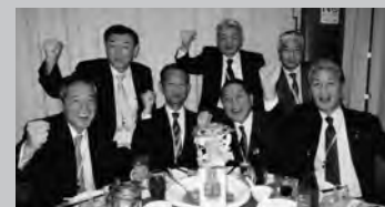
北投温泉歓迎レセプションにて