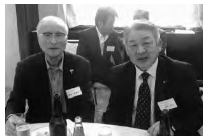
懇親会にて大先輩と一緒に